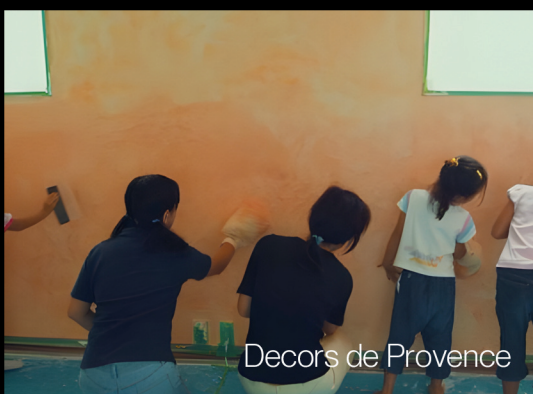
Decors de Provence