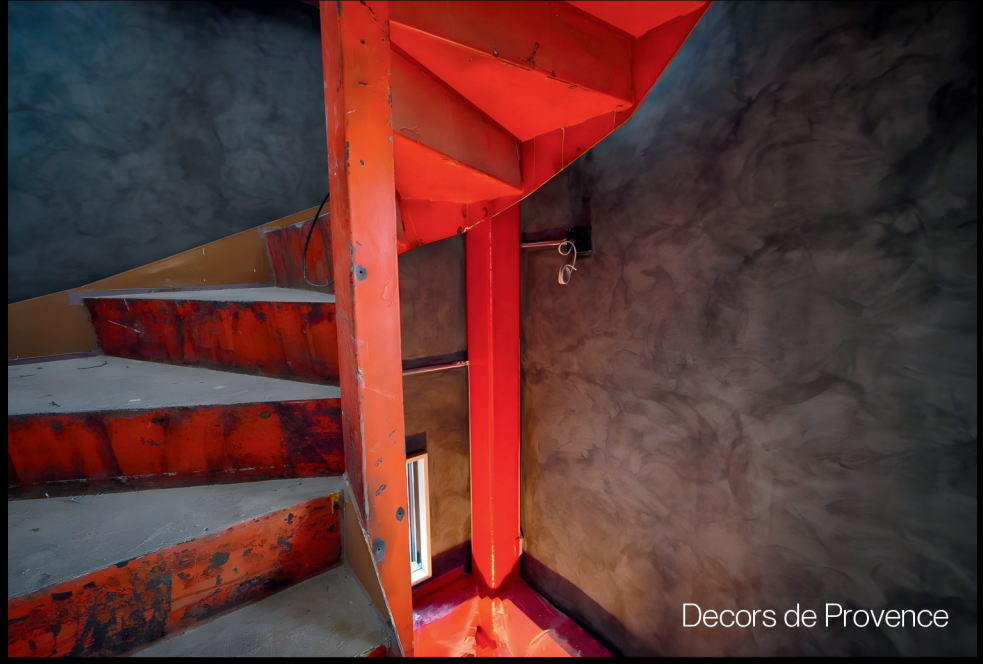
Decors de Provence