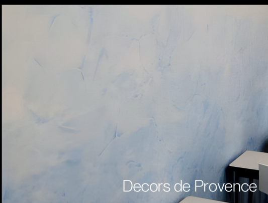
Decors de Provence