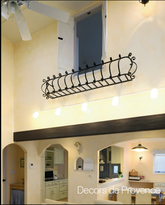
Decors de Provence