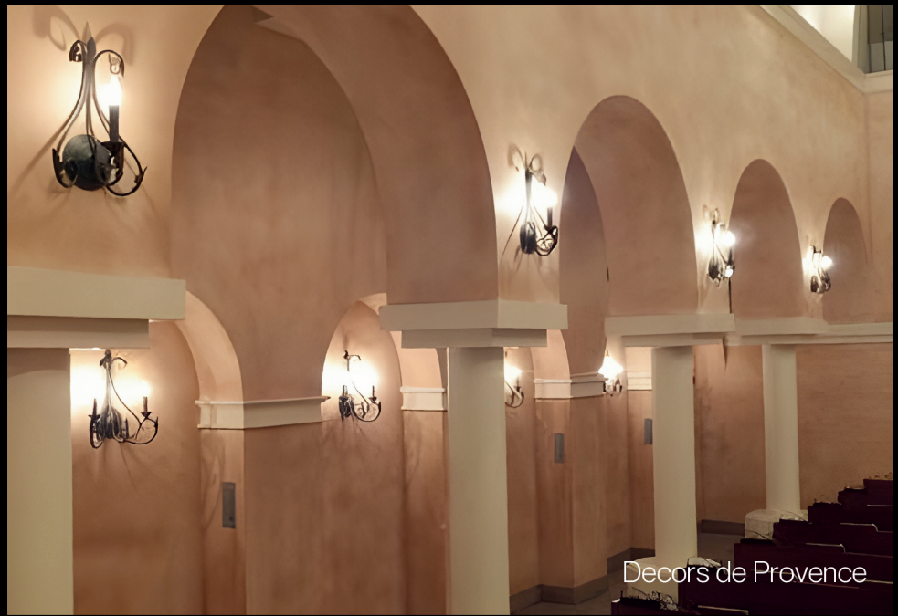
Decors de Provence