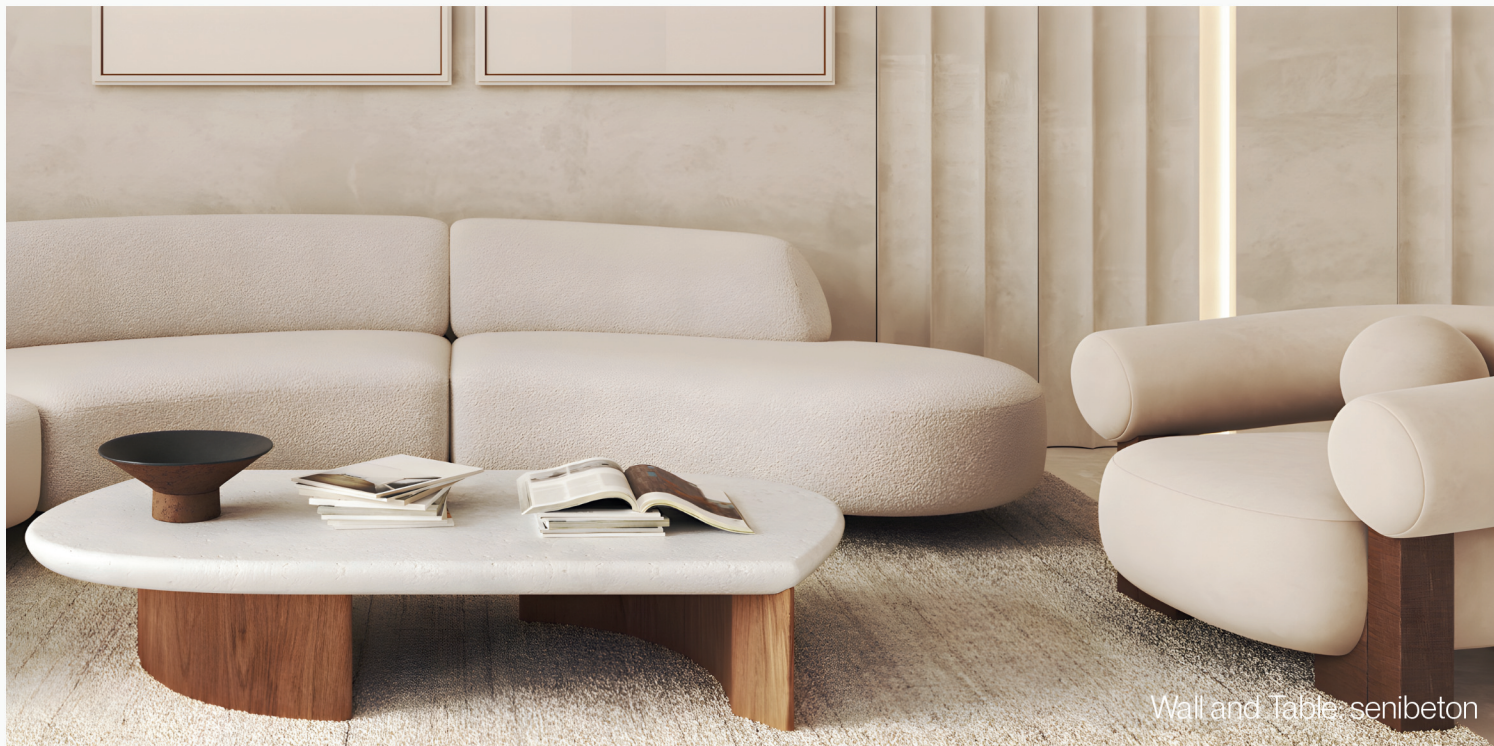
Wall and Table: senibeton