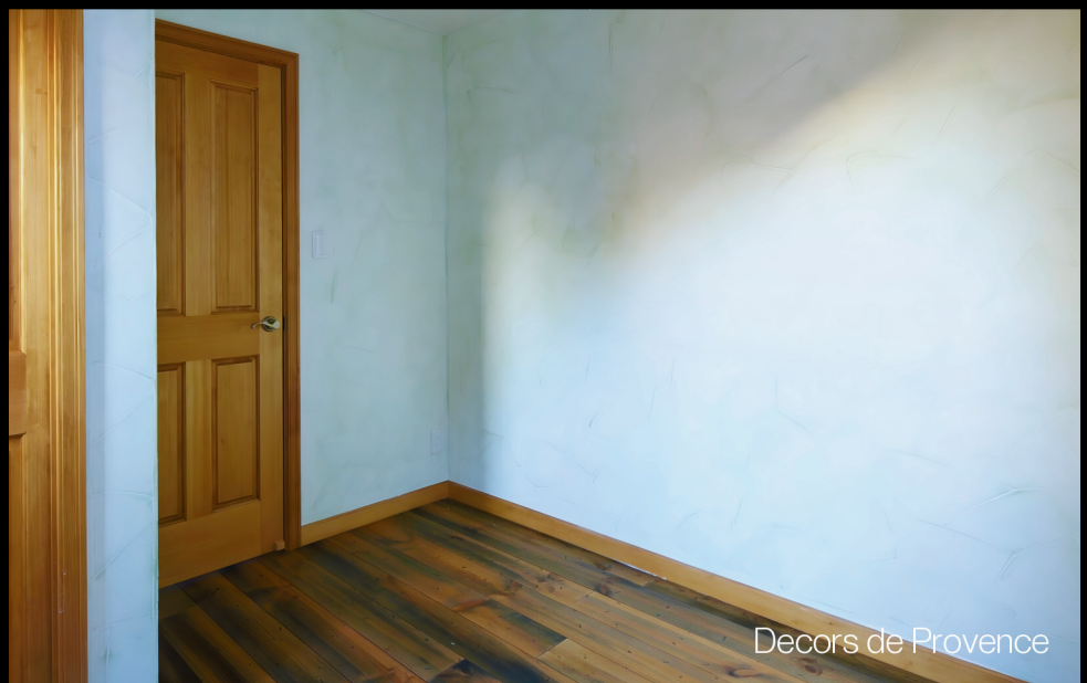
Decors de Provence