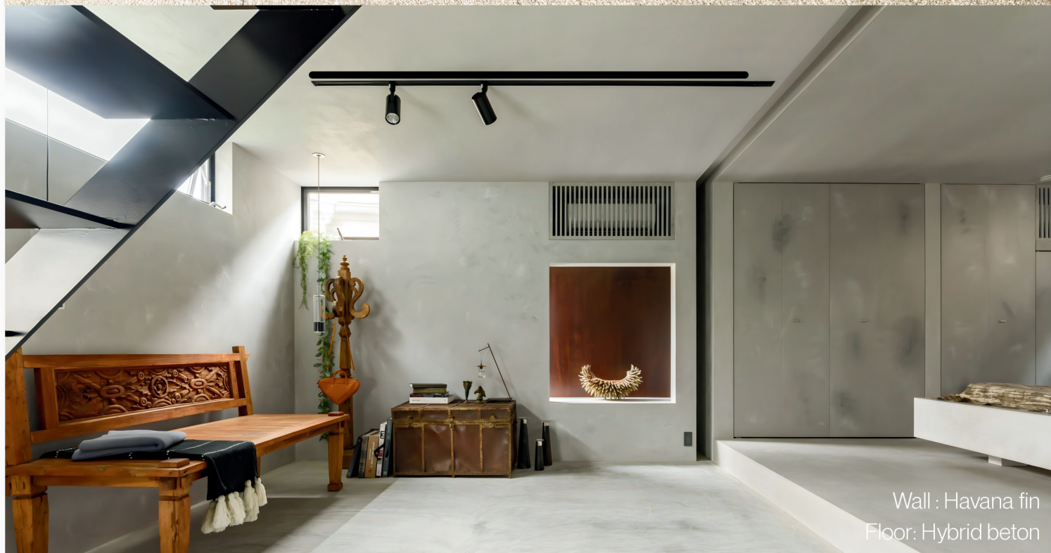
Wall : Havana fin Floor: Hybrid beton

仕上げ方法は特殊なものが多いため、施工は講習受講の認定施工会社様へご依頼ください。