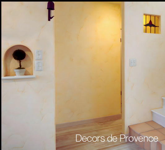
Decors de Provence