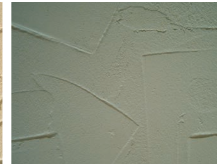
Sto リットMP (トロウエル仕上げ)