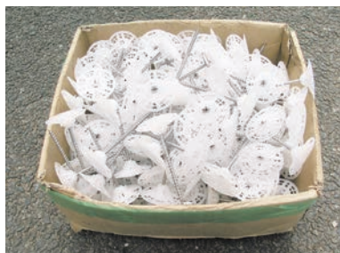
ワッシャー+ビスの準備