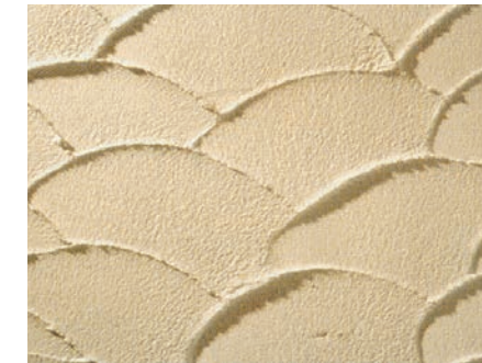
Sto リットMP (セクター仕上げ)