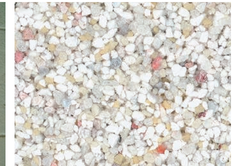
Stoスーパーリット (自然石仕上げ)