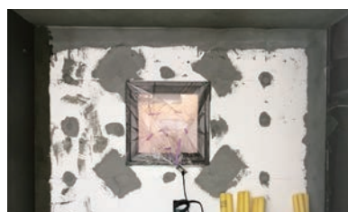
ワッシャー-目つぶしと斜め補強メッシュ