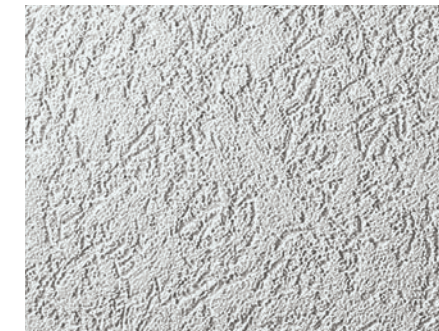
Sto リットR (R1.5仕上げ)

60年以上前に開発されたセメントフリープラスターは質感があり、温かみのある左官仕上げ材です。トップコートは3種類でRは小川のせせらぎを、Kは印象的な点描を、MPはフリースタイルなので様々なテクスチャーが可能です。さらに自然石で仕上げるStoスーパーリットや超撥水性のあるStoロータサンもオプションで用意しています。