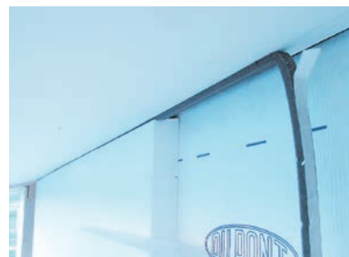
シーリングテープの施工