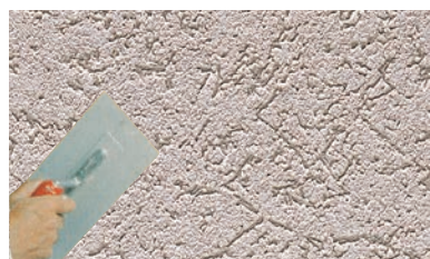
トップコートの施工