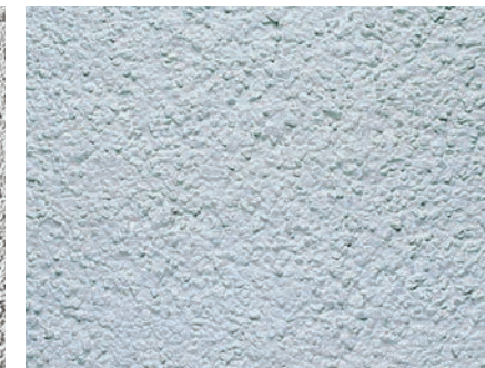
Sto リットK (K1.0仕上げ)