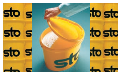
国内で調色されるトップコート