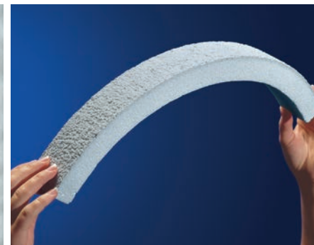
高い弾性と耐亀裂性