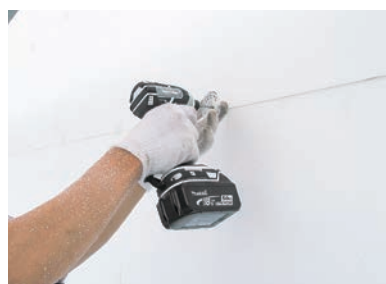
EPS断熱材とワッシャーの施工