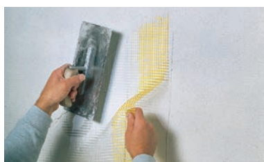
ベースコートと補強メッシュの施工