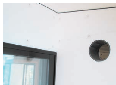
軒天・サッシ及び設備との取合