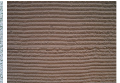
Sto リットMP (楕引仕上げ)