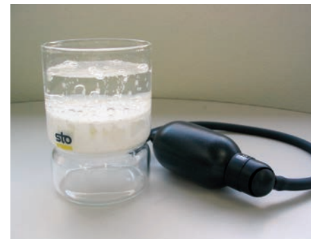
微小多孔性透湿構造