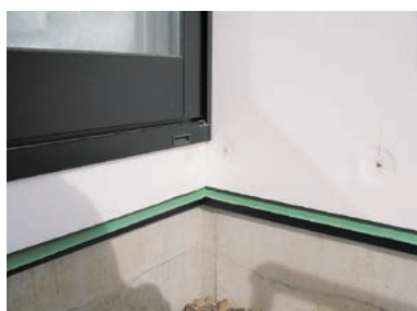
サッシ及び基礎との取合