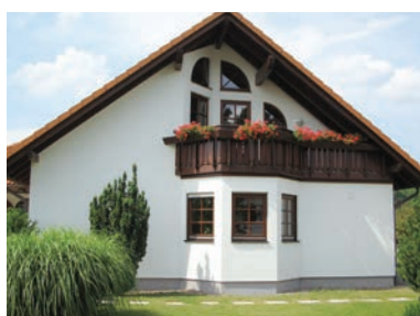
メンテナンス完成